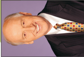
Dr. Jack Hayford

El contenido del currículo es excelente. Es suficiente para equipar a alguien de baja escolaridad, pero sofisticado para ser aceptado en King's Seminary. TUMI tiene la credibilidad para entrenar líderes urbanos sin extraerlos de su origen cultural.